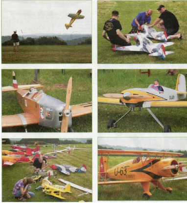
Rückblick Tag der offenen Tür